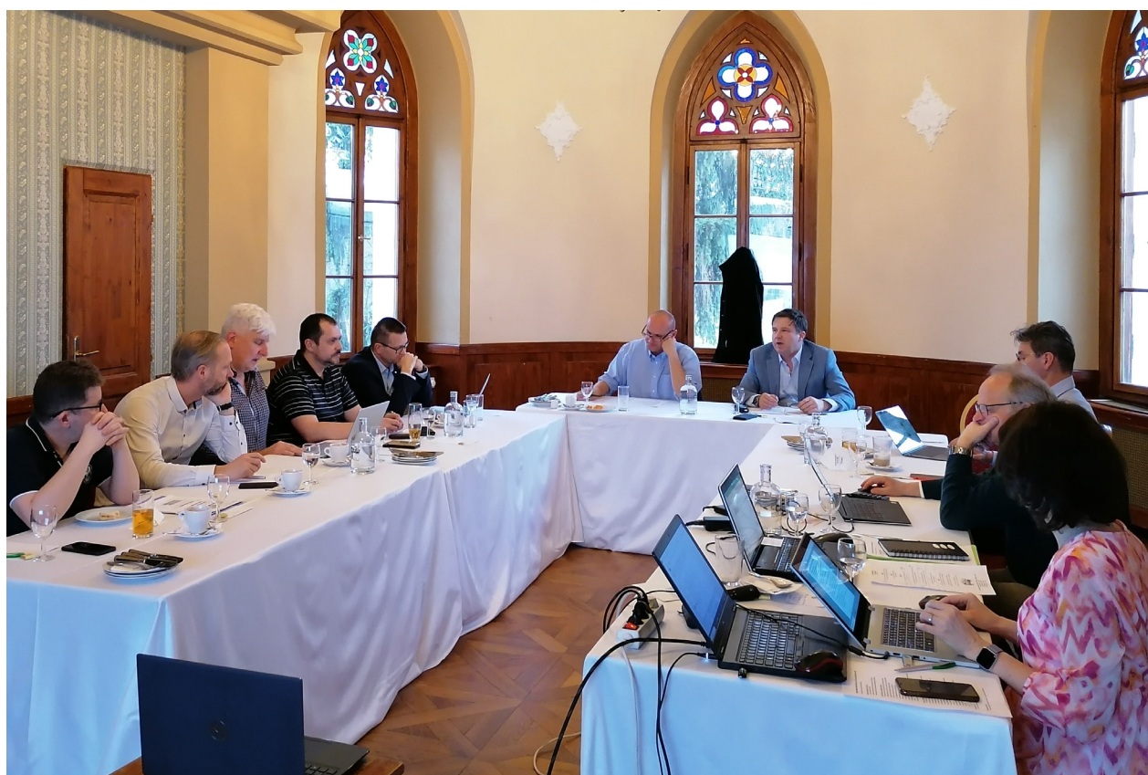
Schůze výboru ČUS 16. 2. 2022

Na webových stránkách ČUS jsou publikovány zápisy z prosincové schůze výboru ČUS | ZDE | a první schůze konané v letošním roce | ZDE |.