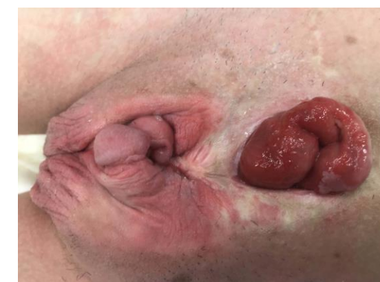
Chlapec 14 let s exstrofií kloaky, píštěl m.m., rozštěp penisu