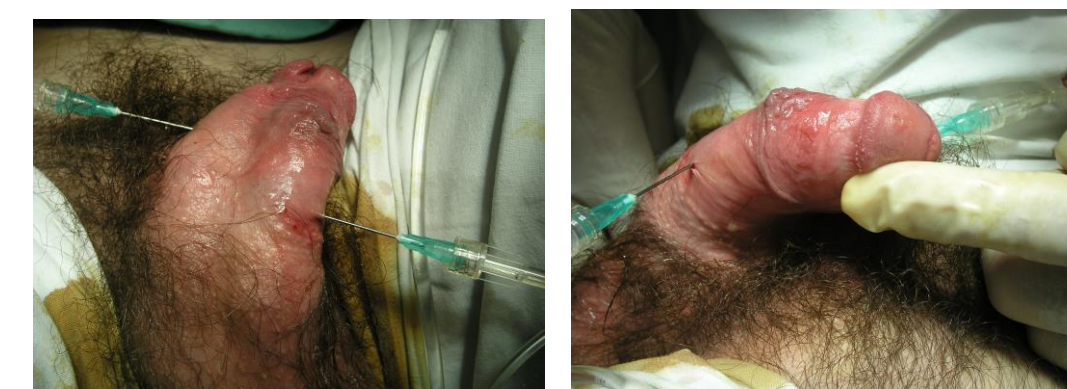
Chlapec 15 let po operaci epispadie, dorzální zakřivení penisu – před ortoplastikou (disassembly penisu)